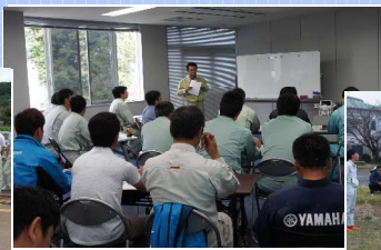
安全講習会（講義・実技）